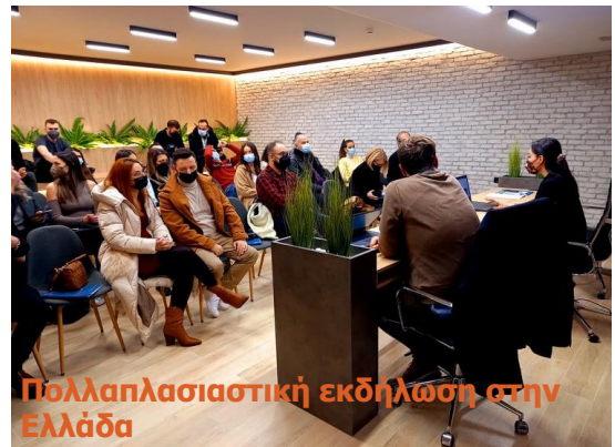
Πολλαπλασιαστική εκδήλωση στην Ελλάδα

❖ «Αποστολή μας είναι η δημιουργία ενός διεθνούς δικτύου διαπολιτισμικών διαμεσολαβητών που θα υποστηρίζει τους νέους και τα νεαρά άτομα με μεταναστευτικό υπόβαθρο για την ένταξη, την ενεργή συμμετοχή και την ενσωμάτωσή τους. Σας προσκαλούμε, λοιπόν, με ενθουσιασμό να συμμετάσχετε στις προσπάθειές μας για τη δημιουργία μιας περισσότερο ανοιχτής και ανθεκτικής κοινωνίας».