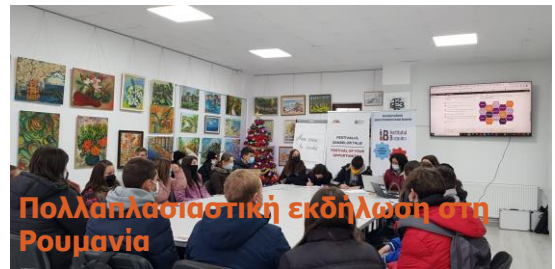
Πολλαπλασιαστική εκδήλωση στη Ρουμανία